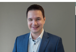
Wirtschaftspolitischer Sprecher der CDU-Fraktion, Marcel Scharrelmann:

https://cdultnds.de/2025/01/29/berufsorientierung-staerken-nicht-weiter-abwarten-wir-muessen-jungen-menschen-echte-perspektiven-bieten/