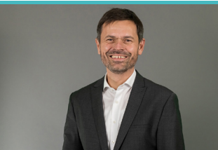
Baupolitischer Sprecher der CDU-Fraktion, Christian Frölich:

https://cdultnds.de/2025/01/29/illegale-migration-und-rechtspopulisten-stoppen-sicherheit-fuer-die-menschen-in-niedersachsen-gewaehrleisten-rot-gruen-darf-sich-nicht-verweigern/